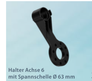
Halter Achse 6 mit Spannschelle Ø 63 mm 3