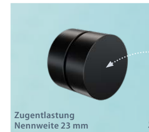
Zugentlastung Nennweite 23 mm 5