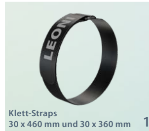
Klett-Straps 30 x 460 mm und 30 x 360 mm 1