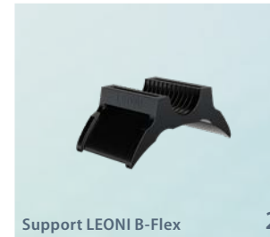
Support LEONI B-Flex 2