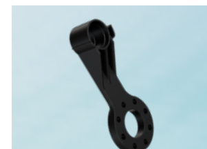
Ось держателя 6 с опорой для запястья Ø 63 мм 3