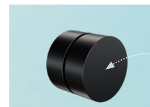
Распределитель кабелей Ø 23 мм 5