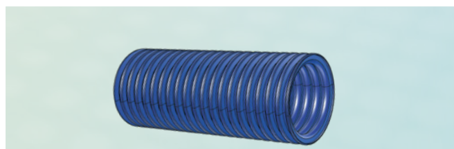
Гофрированный шланг LEONI proflex Ø 17 мм и 23 мм, синий 4