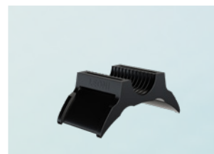
Держатель LEONI B-Flex 2