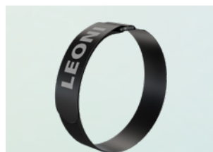
Фиксатор на липучке 30 x 460 мм и 30 x 360 мм 1

Компоненты для легковесных и коллаборативных роботов