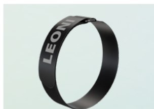
尼龙搭扣 30 x 460 mm and 30 x 360 mm 1