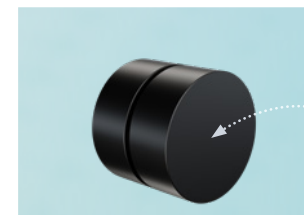
电缆分线器 Ø 23 mm 5